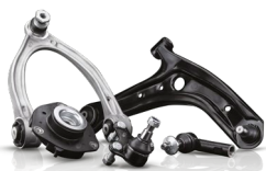
ZAWIESZENIE I UKŁAD KIEROWNICZY