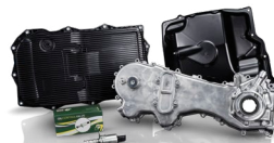
ZAWORY OLEJU, MISKI I POMPY DO OLEJU