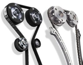
PASKI/ ŁAŃCUCHY ROZRZĄDU